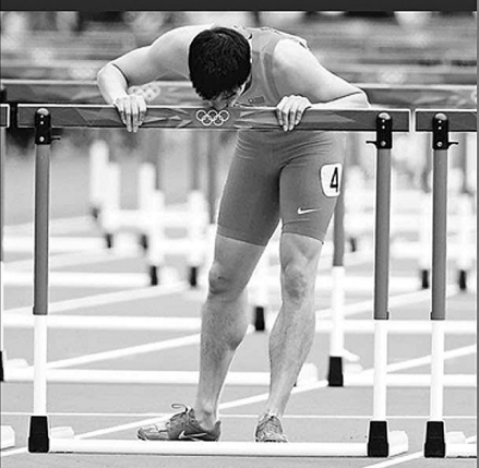
伦敦留下最后一吻