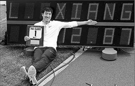
光辉时刻忘记痛苦