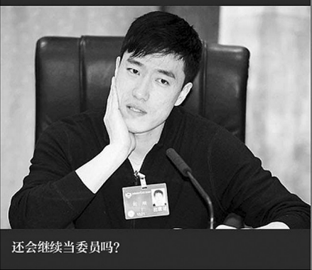
还会继续当委员吗？