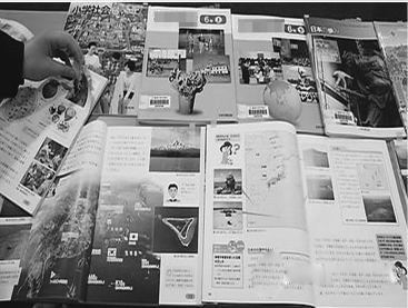
图为包含日本拥有独岛主权内容的教科书。

日本新闻网的报道指出，日本文部省表示，有关日本承认“侵略和殖民统治”的村山谈话，教科书上追加了“日本政府已经通过国家赔偿等途径解决了历史问题”的内容。