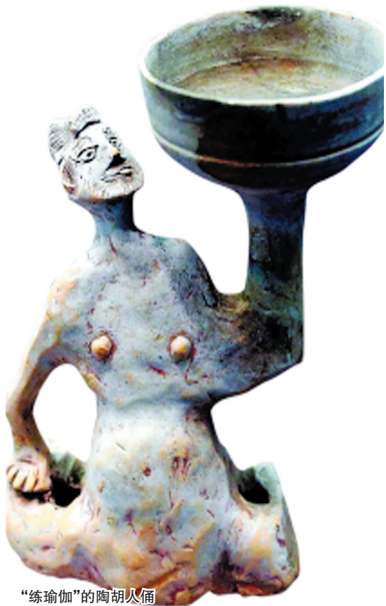
“练瑜伽”的陶胡人俑

作人员把它固定起来。瓶子上的花纹艳丽,正面分为上下两幅图,看上去很复杂。“这些瓷器都迎合了老外审美的中国瓷。”专家介绍说,清代,广州是当时对外贸易的最大口岸,外商云集,这件海棠形瓶就是按照订约合同根据外商需要定制生产的。“为符合外国人的审美,瓷器花纹半中半西,甚至全部欧化。”