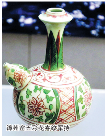
漳州窑五彩花卉纹军持