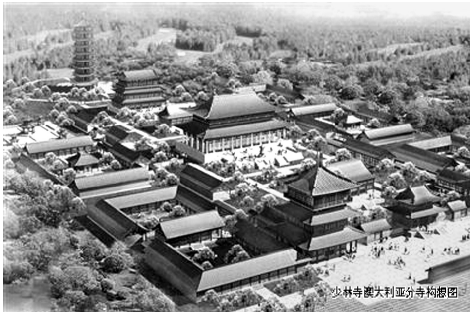
少林寺澳大利亚分寺构想图

但自最近少林寺接手项目后,由原来的综合性思路向单纯方向转变。“现在换样了,以少林的方式做一个寺庙。”该负责人介绍说。