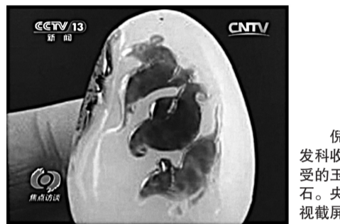
倪发科收受的玉石。