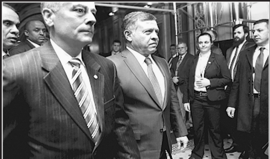
3日，在华盛顿国会山，约旦国王(中)在飞行员遭杀害被证实数小时后公开露面。