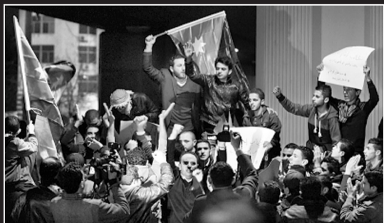
约旦愤怒民众上街抗议飞行员被杀。