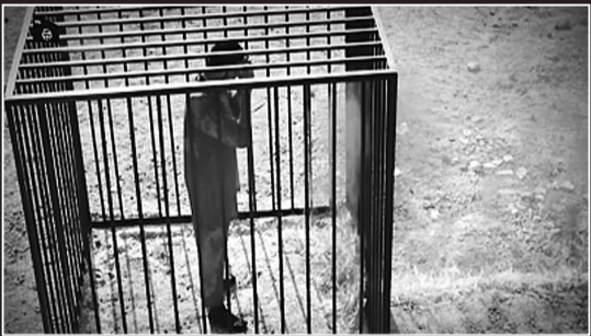
IS发布视频：飞行员被活活烧死。