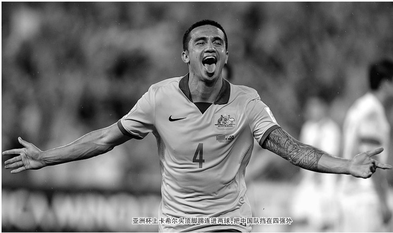
亚洲杯上卡希尔头顶脚踢连进两球，把中国队挡在四强外

上港有孔卡，申花来了卡希尔，上海足坛新赛季将呈现“双卡双待”的新局面。北京时间今天凌晨，绿地申花俱乐部通过官网对外宣布：澳大利亚现役国脚蒂姆·卡希尔已与美国大联盟球队纽约红牛达成解约协议，正式加盟申花，双方签约1年。36岁的卡希尔就此将开始他在中国的全新冒险生涯，其年薪约在300万美元左右。