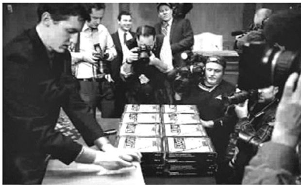
国会工作人员在摆放2016财年预算案文本。

从民主与共和两党术业专攻类别而言,民主党在国防安全层面有软肋,近几年在全球军事活动范围内的“疲软”更容易在总统选举中成为共和党攻击的对象。不少评论家认为,奥巴马推出高额国防预算是为2016年大选本党总统候选人铺路。