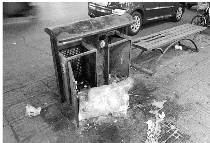
市中区吉品街上的垃圾箱被人为损坏,虽然垃圾箱内是空的,但垃圾还是被人扔在了箱外,周围污水横流,肮脏不堪,严重影响城市形象。