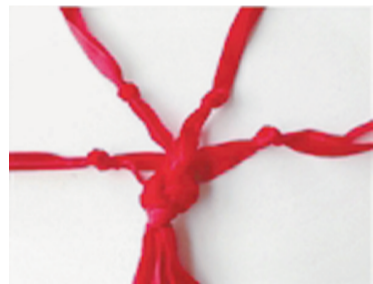
把打完结的两根再拆分，与边上那个结的一个分支组成一个新结。这样，一个网状的托就完成了。