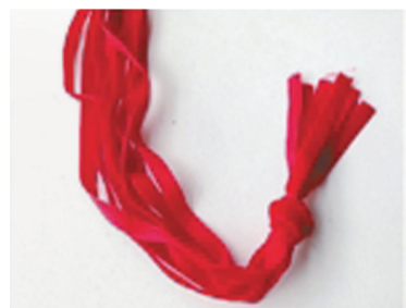
将剩余长度的绸带，分别以两根为一单位，打结。（这个小结和Step1中大结的距离，要按每个花盆的大小来定）。