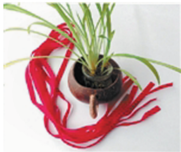
将8根绸带捆在一起，在距离尾端5厘米处，打结，形成流苏。

准备材料：旧布剪成8条长短一致的布条，或者8根绸带。盆子大的可能考虑更多根数，但需要双数。