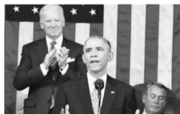
奥巴马发表国情咨文演说时,民主党副总统拜登(左)起立鼓掌,共和党众议长博纳(右)却无精打采。