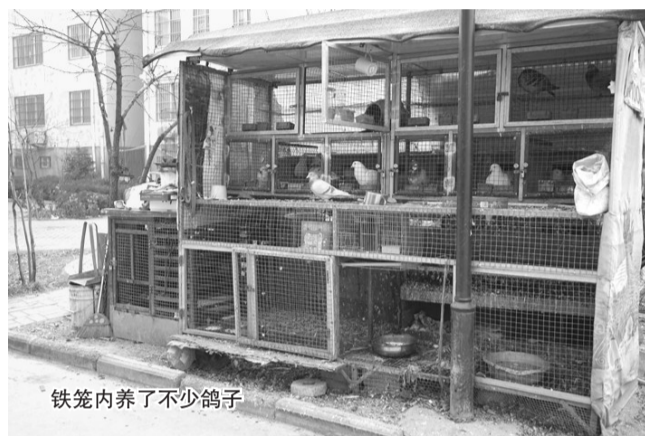
铁笼内养了不少鸽子

日前，在滕州城区内有居民在小区内饲养鸽子，很是扰民，同时也严重影响到了小区的整体环境。