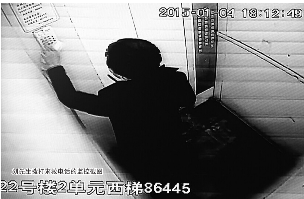
刘先生拨打求救电话的监控截图