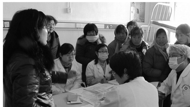
近日,薛城区周营镇中心卫生院为农村妇女进行“两癌”筛查。短短两天时间内共筛查200余人次。图为“两癌”筛查现场。

赶到现场后,记者刚走到换乘中心靠北面的停车场,就在停放的车后靠墙根的地方,发现了很多水迹。因气温较低,在现场并没能闻到刺鼻的气味。就当记者刚走了一个来回,一名等车的乘客在车后转了又转,最终选定了一处“自认为别人看不到的地方”,随地方便了起来。方便处离南面等车的乘客直线距离不过数十米,其中有些等车的乘客似乎已经观察到了这一幕,但或许是