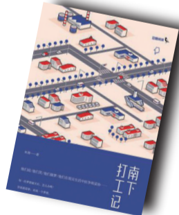
▲《南下打工记》▲ 作者:米周 中信出版社