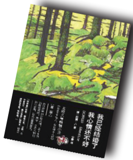
▲《我已经结婚了 我心情还不好》▲ 作者:(挪威)阿澜·卢 浙江文艺出版社

作者简介: 阿澜·卢，挪威当代最负盛名的畅销书作家之一，出生于挪威中部城市特隆赫姆，职业涉猎甚广，在精神康复中心做过勤务，当过报社自由撰稿人，目前为专职作家和剧作家。