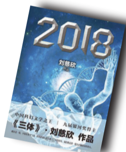
▲《2018》▲ 作者:刘慈欣 江苏凤凰文艺出版社

作者简介: 刘慈欣，中国作家富豪榜当红上榜作家，当代新生代科幻的主要代表人，中国科普作协会员，山西省作家协会会员。1963年6月出生于北京，祖籍信阳市罗山，山西阳泉长大。1985年毕业于华北水利水电学院（现华北水利水电大学）水电工程系。代表作有长篇小说《超新星纪元》《球状闪电》“地球往事”系列（《三体》，《三体II：黑暗森林》及《三体III：死神永生》）等；中短篇《流浪地球》《乡村教师》《朝闻道》《全频带阻塞干扰》等。曾多次获得中国科幻银河奖，并荣登2013第八届中国作家富豪榜。