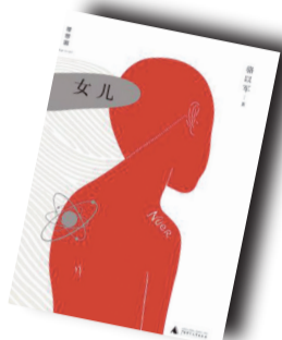
▲《女儿》▲ 作者:骆以军 广西师范大学出版社

内容简介: 魔术时刻戏剧性滚落的泪珠，精密练习过上千次的侧脸低头微笑——给下一轮太平盛世的，女儿。