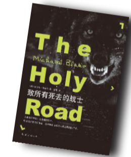
▲《致所有死去的战士》▲ 作者:(美)迈克尔·布莱克 南海出版公司

作者简介: 迈克尔·布莱克，1945年7月5日出生于美国得克萨斯州，后随父母迁至南加州。《纽约时报》榜首畅销书《与狼共舞》作者，1991年因其改编剧本获奥斯卡金像奖。迈克尔目前依然从事着写作，他现居亚利桑那州沙漠的一处农场，同时致力于宣传保护濒危物种美洲平原野马。