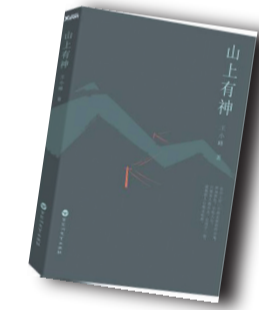
▲《山上有神》▲ 作者:王小峰 百花洲文艺出版社

作者简介: 王小峰，作家，《三联生活周刊》资深主笔，著名博主。出版图书有《不是我的火》《欧美流行音乐指南》《不许联想》《文化@私生活》《沿着瞭望塔》《答案从未在风中飘过》。