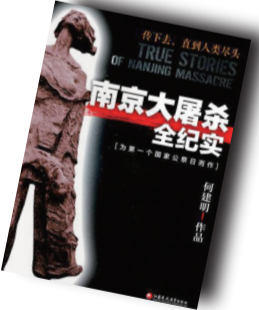
▲《南京大屠杀全纪实》▲ 作者:何建明 江苏凤凰教育出版社

作品曾七次获“全国优秀报告文学奖”，三次获“鲁迅文学奖”，五次获“中宣部五个一工程奖”，三次获“正泰杯报告文学奖”，四次获“徐迟报告文学奖”。