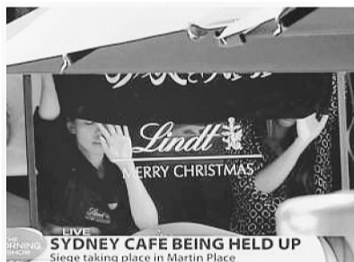
一面疑似极端组织的旗帜清晰可见。