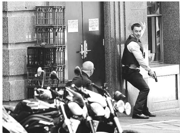
特警小组火速包围现场。

阿博特说，尚不知道咖啡厅劫持案是否具有政治动机，但有此可能性，此举很有可能是为恐吓澳大利亚民众。他说澳大利亚是个和平、开放的国度，尽管目前情况很危急，但希望公民能正常工作、国家正常运转。路透社报道，澳大利亚当局称，目前悉尼南部的国际和国内机场航班起降均正常。