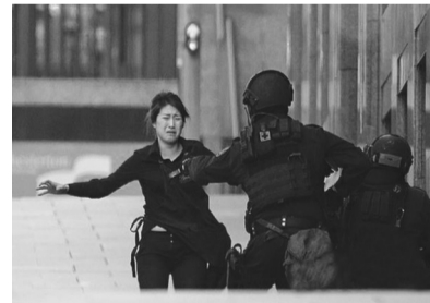
一名被劫持的女子从咖啡馆逃出。