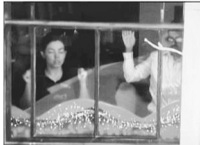
多人人质被迫举起双手。