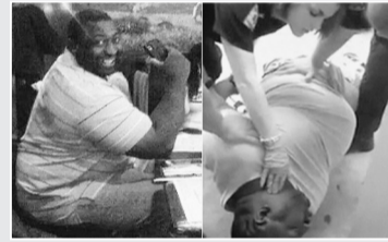
验尸官证明小贩已死亡