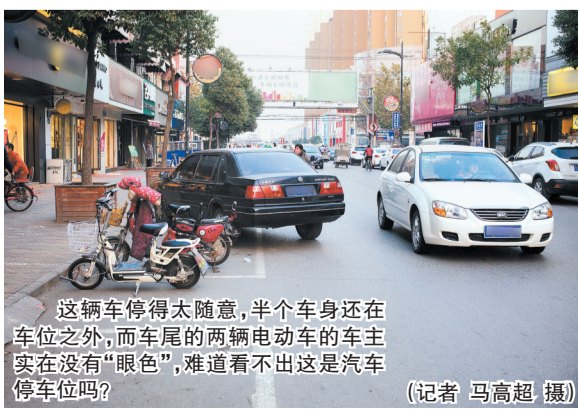
这辆车停得太随意,半个车身还在车位之外,而车尾的两辆电动车的车主实在没有“眼色”,难道看不出这是汽车停车位吗?