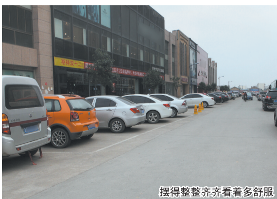
摆得整整齐齐看着多舒服