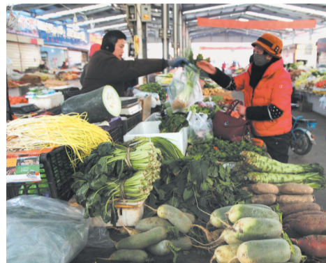
12月3日,市民在市中区龙头市场选购蔬菜。冬季,地产辣椒、卷心菜、茄子、西红柿、大白菜等新鲜蔬菜一应俱全,价格在0.3至2元,深受市民喜爱。

区进进出出的行人竟然是熟视无睹,任其随意进出。调查中记者发现,记者所采访的10个小区中,仅有一个小区的保安在记者进入小区时进行了询问,记者随口说要找某人,对方也并未加以阻拦。