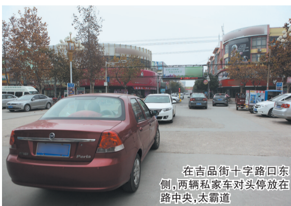
在吉品街十字路口东侧,两辆私家车对头停放在路中央,太霸道