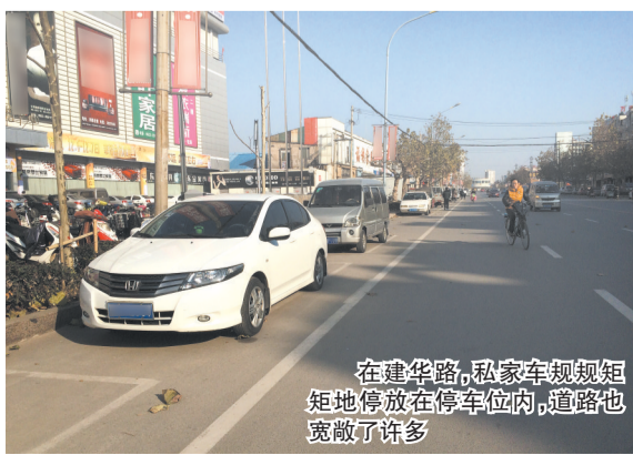
在建华路,私家车规规矩矩地停放在停车位内,道路也宽敞了许多