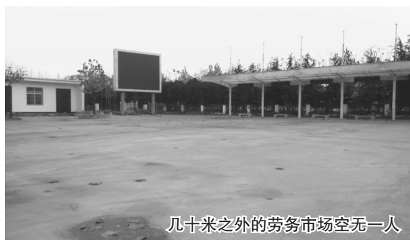
几十米之外的劳务市场空无一人

城市管理局龙泉分局的工作人员说,此处道路因务工人员随意占道成了治理顽疾,让他们深感头疼。“此处占道的务工人员并没有违法的经营行为,只能是劝导他们到市场内找活,可等到城管队员说服劝导完了之后,他们又从市场跑出来了,就这样来来回回,很难管理。”城管工作人员说道。(记者 姚付林 文/图)