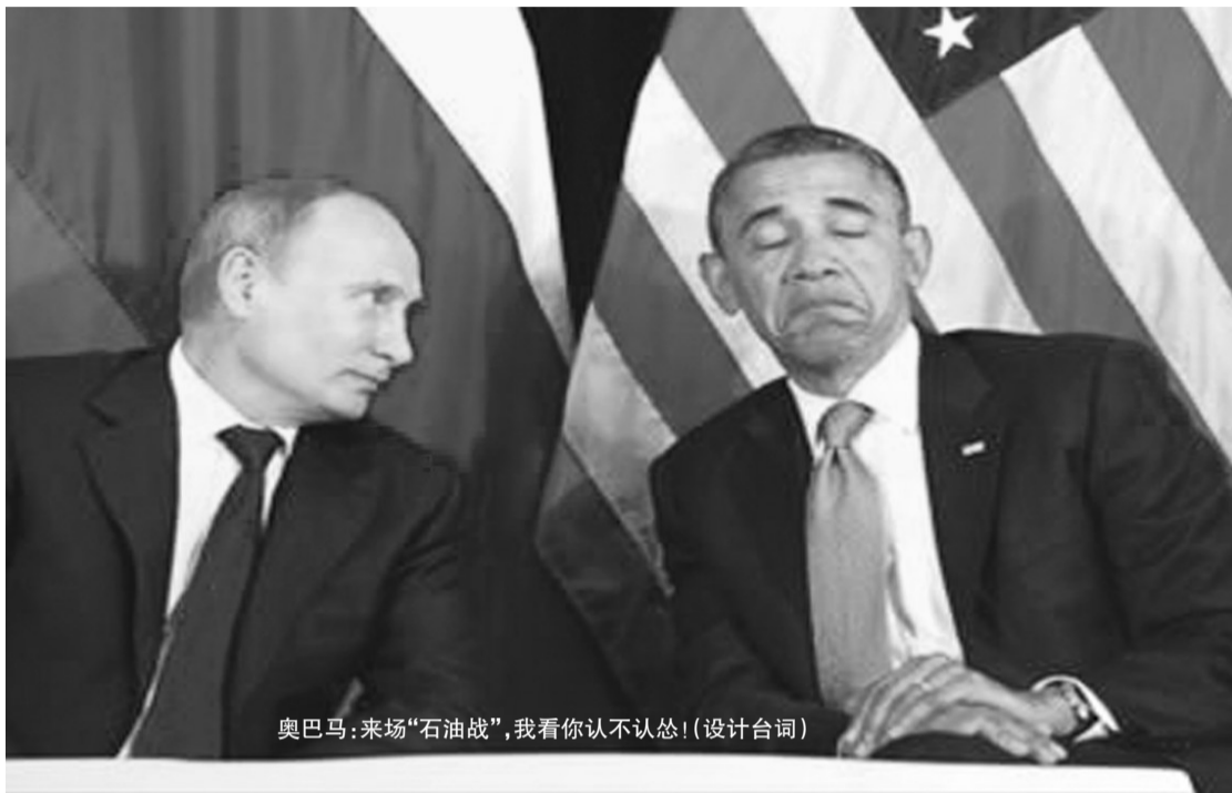
奥巴马:来场“石油战”,我看你不认怂!(设计台词)

近日,欧佩克决定不减产,国际原油价格继80美元后,再度失守70美元整数关口。从今年年中到现在,不到5个月时间,国际油价跌去35%,创下4年来新低,下跌速度着实惊人。