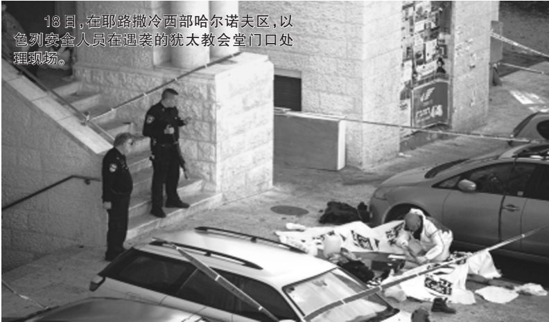
18日,在耶路撒冷西部哈尔诺夫区,以色列安全人员在遇袭的犹太教会堂门口处处理现场。

以色列警方说,两名袭击者来自东耶路撒冷的巴勒斯坦人居住区贾巴勒穆卡贝尔。袭击发生后,该区发生巴勒斯坦人与以色列警方的冲突,警方用路障封闭了通往该区的主要道路。