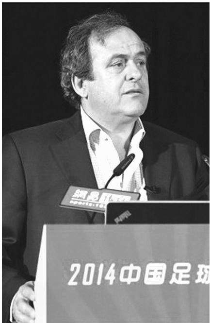
欧足联主席普拉蒂尼致辞

第五届中国足球发展论坛于11月11日在北京举行。2014巴西世界杯,德国队凭借强大青训加冕王冠,故本届论坛以“欧洲王者青训启示录”为主题,特邀欧足联主席普拉蒂尼和前国青主帅克劳琛到会分享欧洲足球青训发展先进经验。此外,本届论坛发布了2014版《中超联赛商业价值报告》,并独家呈现《中国职业联赛青训调查报告》,从商业、青训等多方面解析中国足球发展。