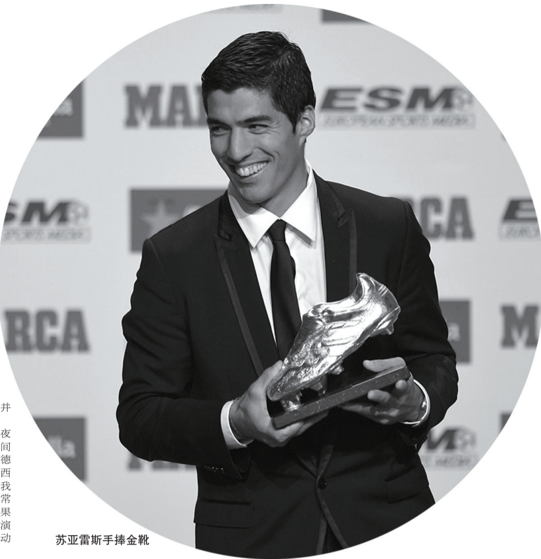
苏亚雷斯手捧金靴

苏亚雷斯将于10月24日午夜正式解禁,恰好可以参加当地时间10月25日巴萨客场挑战皇家马德里的西班牙国家德比,这是一场西甲第9轮的比赛。苏亚雷斯说:“我距离解禁时间不长了,我必须非常耐心,并时刻为此做好准备。如果能在伯纳乌球场对皇马的比赛上演我在巴萨的处子秀,那真是太激动人心了。”