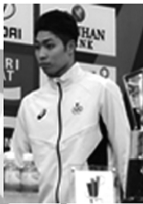
日本名将萩野公介的实力令孙杨不容小觑。

在其余比赛中,在亚运会上一鸣惊人的宁泽涛在副项50米蝶泳中以23秒65获得银牌,以0秒04的微弱差距负于山东选手张麒斌。对这样的成绩宁泽涛表示满意。200米仰泳决赛,浙江小将徐嘉余夺冠,北京队获得女子4×200米自由泳接力冠军,上海选手张思诗摘取女子200米个人混合泳金牌,广东选手刘湘夺得女子50米仰泳冠军,上海的陆滢收获女子50米蝶泳金牌。