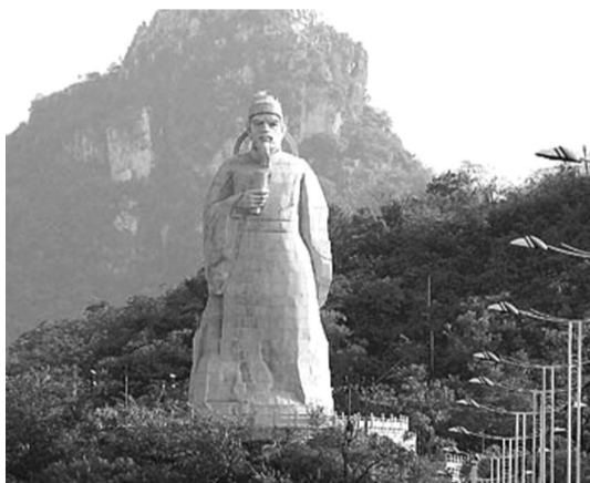
按照规划,柳州斥资7000万元建设的柳宗元雕像建成后高达68米,可以360度旋转。这座被称为“国内最高的人物铜像”的项目尚未建成,9月起就已被拆。