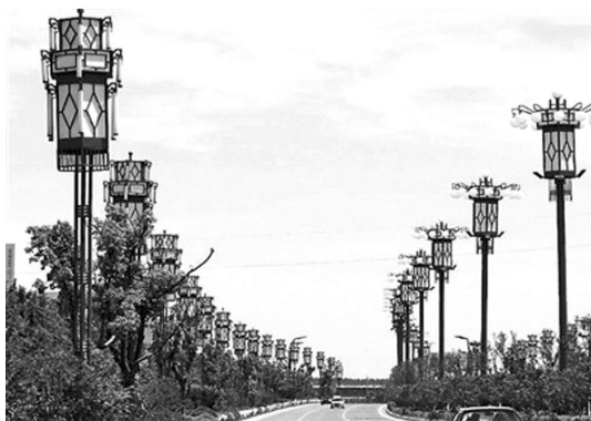
国家级贫困县灵璧县,长达8公里的景观大道两侧共有3排路灯,采用唐代宫灯样式路灯每隔30米一盏,合计近千盏,一年就要“亮”掉约300万元电费。