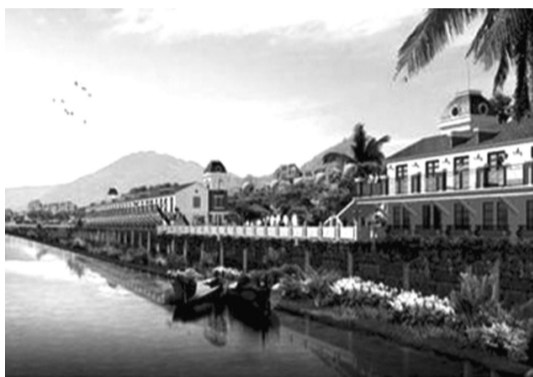
今年6月,河口斥资2.7亿元建设的“文化长廊”在建成3年后,又花费3亿元拆除。