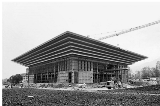
位于鄂西山区的房县,耗资8000万元建新行政中心建筑群,“形似世博会中国馆”的豪华办公楼群超批复投资3000多万元、超面积近1800平方米。由于项目资金来自政府举债、开发商垫资建设,因此,目前以及未来很长的时间,政府都需要继续为巨额负债还钱。