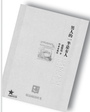
《男人的一半是女人》