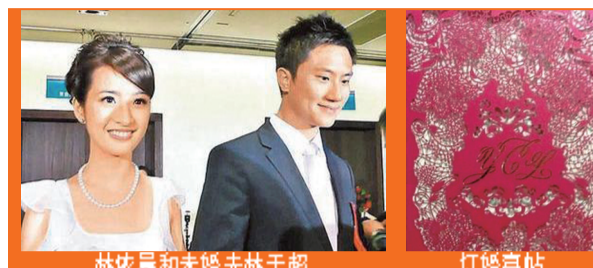
林依晨和未婚夫林于超