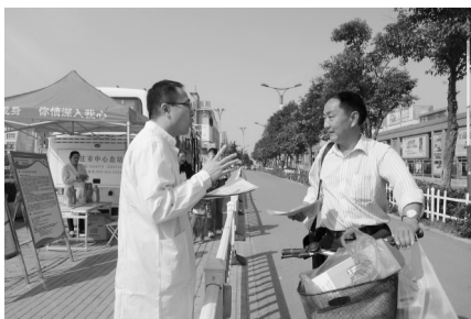
参加活动的党员干部在向路人讲解献血知识