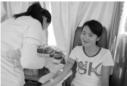
顺利献血后小姑娘露出调皮的笑容