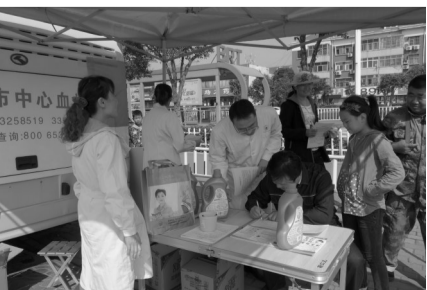
参与活动的党员干部在指导献血者填表