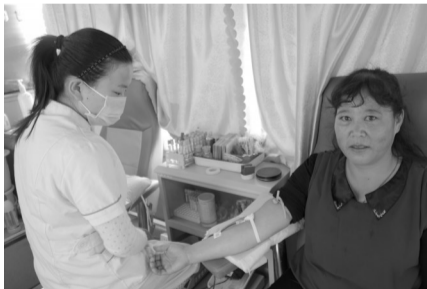
国庆当天,第一个献血的爱心献血者

10月1日是祖国母亲的65岁生日,也恰逢《中华人民共和国献血法》颁布16周年。枣庄市献血办、枣庄市中心血站在全市各个采点举办了“十一”双庆无偿献血活动,广大市民纷纷走上献血车,用无偿献血的方式向祖国献上一份特殊的礼物。据统计,10月1日——7日国庆小长假期间,我市共有532名爱心市民在全市各献血点无偿献血,累计无偿献血总量达194000毫升。