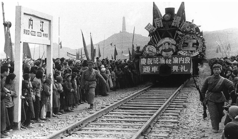
▲1952年7月1日,新中国成立以来第一条由自己设计、自己建造、材料零件全部为国产的成渝铁路,在重庆、成都两市同时举行隆重的通车典礼。

和克服,并防止官僚主义倾向发生。他要求参加修路的部队要遵守劳动纪律,学会掌握修路技术,尊重技术人员的指导,紧密团结起来工作。1952年7月,成渝铁路建成通车。该路全长505公里,完全由中国自行设计施工,采用国产材料修建。这条铁路是清朝末年就酝酿兴建的川汉铁路的一段,拖了近半个世纪没有铺上一根钢轨,而新中国成立后仅用两年时间就建成通车。成渝铁路的建成,推动了西南地区经济的恢复和发展。毛泽东为成渝铁路建成通车题词“庆贺成渝铁路通车,继续努力修筑天成路”。邓小平的题词是:“庆祝成渝铁路全线通车”。