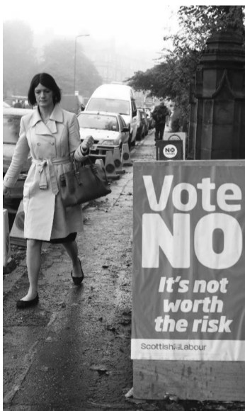
9月18日,在英国爱丁堡,一名女士在投票后离开投票站。

17日的民调结果显示,51%的受访者反对苏格兰独立,支持苏格兰独立的受访者占49%。