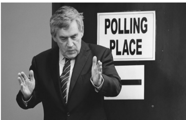
英国前首相布朗在投票站