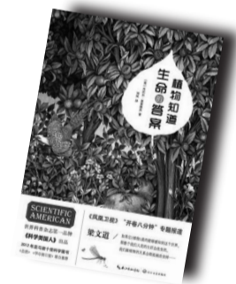
▲《植物知道生命的答案》▲

植物就是植物,尽管被作者赋予了视觉、听觉、嗅觉、记忆、定位等人性化“生理功能”,但植物再如何奇妙,也无法实现类似人类这样拥有思维的跨越性突破。倒是觉得,本书拟人化书写增添的可读性,足以成为国内科普作品的优秀借鉴。一言以蔽之,科普作品并非刻板教条的文字记录,而应像本书这样,运用语言文字表达艺术等多种方式,把那些高深枯燥的知识,尽可能翻译成大众喜闻乐见和乐意品尝的“家常饭”。