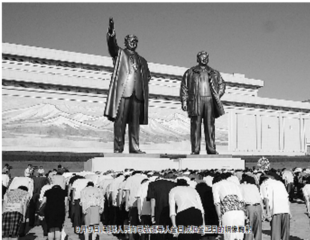
9月9日，朝军人员向已故领导人金日成和金正日的铜像敬礼

朝鲜内阁总理朴凤柱9日说，朝鲜将为打破民族面临的困局、改善北南关系、开创自主统一新局面竭尽全力。