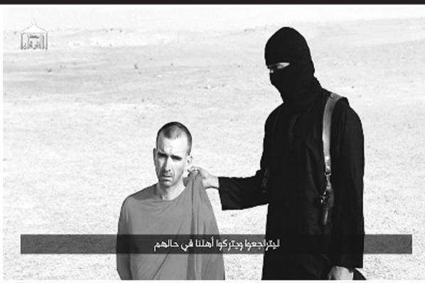
英国人质大卫·海恩斯出现在ISIS最新公布的视频中,该组织威胁要杀死他。