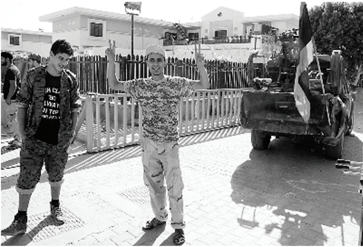
在美驻利比亚大使馆内,武装人员作出胜利手势。

专家表示,即使美外交人员已经撤离,在大使馆被占的情况下,美国也有权提出交涉,要求武装分子结束侵犯。