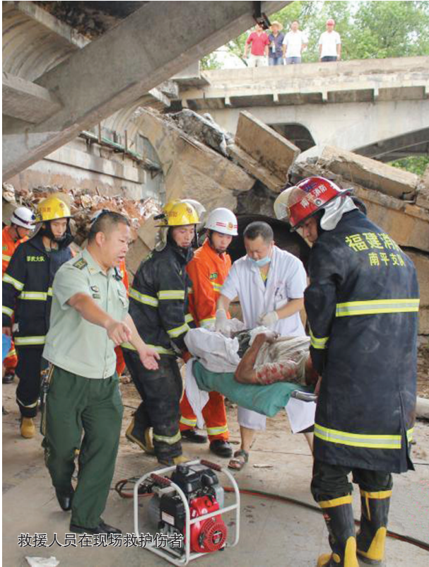
救援人员在现场救护伤者