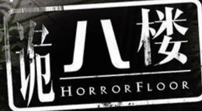
翻拍1989年禁映恐怖电影《黑楼孤魂》