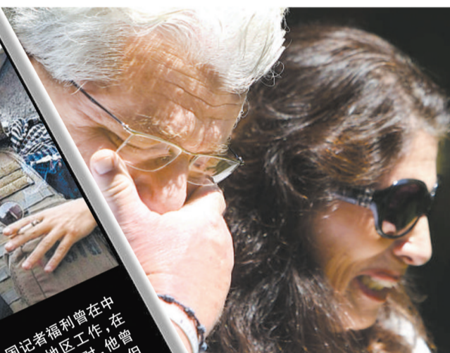
福利的父母痛哭流涕

美国记者福利曾在中东多个冲突地区工作，在报道利比亚内战时，他曾被掳走并遭扣押44天，但一名同行记者不久再赴中东战地采访，但这次没有获幸运之神眷顾。福利于2012年11月22日在叙利亚失踪。据悉，他与其他几个美国战俘被关押在同一个地方。2012年在接受英国广播公司(BBC)的采访时，福利形容他去叙利亚冲突地区报道的原因，是为了报道更多的为人所不知的故事。在工作中，人们形容福利总是热情开朗，乐善好施。