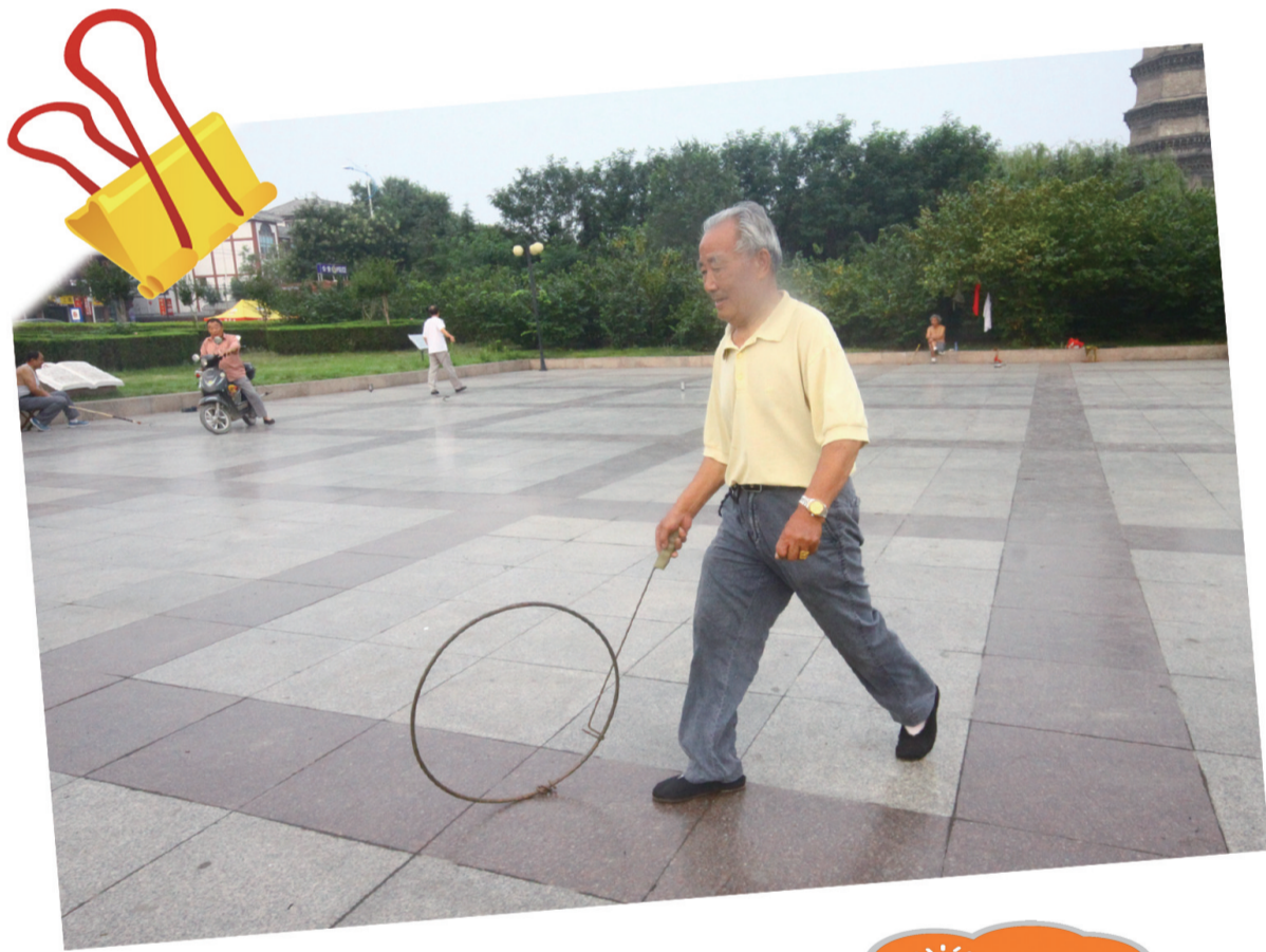
滕州市龙泉广场有位老人在推铁环锻炼身体。推铁环曾是上世纪六七十年代的流行游戏,这位老人说,推铁环有一定的难度,需要一定的技巧,很有趣。