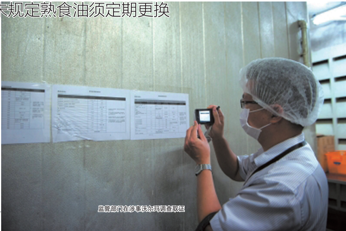
监管部门在涉事沃尔玛调查取证

上海福喜事件余波未平，深圳沃尔玛超市又被曝出后厨内幕：已呈黑色的熟食用油“一个月不换”，使用超过保鲜期的原材料……目前，监管部门已介入调查，但相关结果尚未确定。