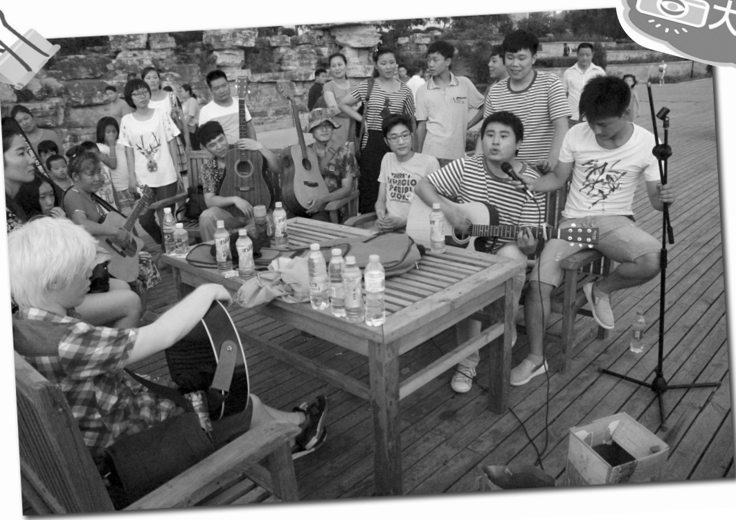
8月3日晚上,不少热爱音乐的人们聚集在东湖广场,举办了场小型的“草地音乐会”。大家拿来吉他、非洲鼓等乐器,在湖边即兴弹唱,吸引了不少市民前来欣赏。