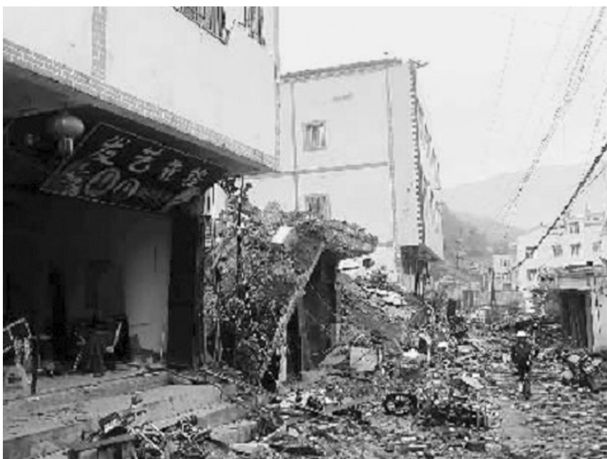
▲会泽县纸厂乡受灾现场