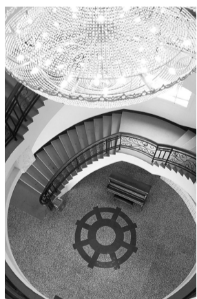
黑龙江省国税局牡丹江培训中心别墅楼内景

记者近日在黑龙江、吉林、辽宁三省调查发现,这些藏身风景名胜区的培训中心大多奢华消费尚存、运行不计成本、资源严重浪费,问题不少。