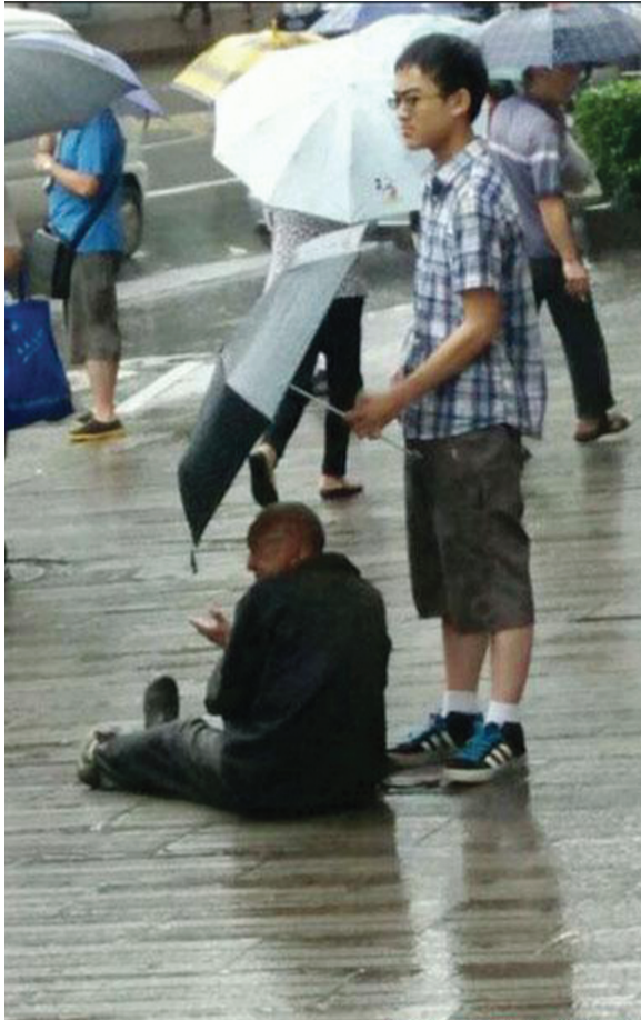
图为小伙雨中给行乞老人撑伞(图据网络)

在网友热议行乞老人的身份中,网友“jfxh80122”回帖:“先不说老人!必须要为孩子的这份爱心和行动赞一个!”