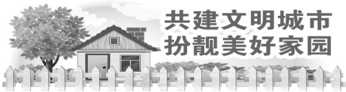
共建文明城市 扮靓美好家园

地处市立医院东面的龙光路，路边小吃摊点多，小巷内车辆来往频繁，再加上一些车辆乱停乱放，经营的快餐摊点排放的餐厨废水和漏出剩油的竹篓等严重影响了此处的交通。