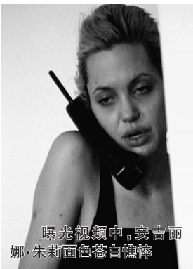
曝光视频中,安吉丽娜·朱莉面色苍白憔悴

梅耶还向媒体透露,在那个时期,只要朱莉在这座城市,她平均每个星期都会购买两到三次毒品,而每一次朱莉一般都会花100美元左右来购买海洛因和可卡因。交易的地点会选在朱莉的公寓、酒店,甚至是聚会上。据梅耶