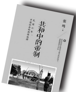
▲《共和中的帝制》▲ 作者:张鸣 当代中国出版社