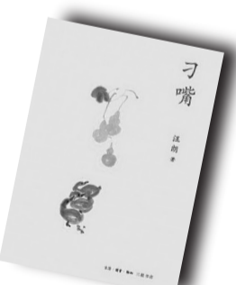
▲《刁嘴》▲ 作者:汪朗 生活·读书·新知三联书店