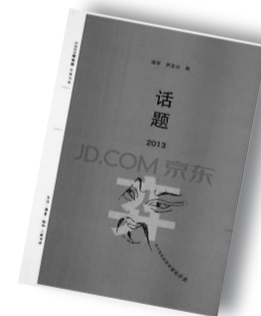
▲《话题2013》▲ 作者:杨早 / 萨支山 生活·读书·新知三联书店