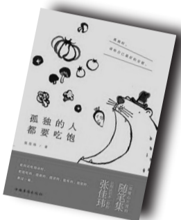
▲《孤独的人都要吃饱》▲ 作者:张佳玮 中华华侨出版社