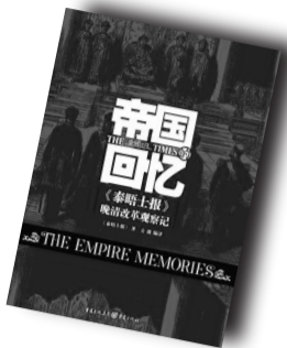
▲《帝国的回忆》▲ 作者:《泰晤士报》 重庆出版社