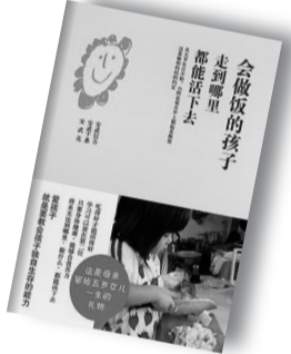
▲《会做饭的孩子走到哪里都能活下去》▲ 作者:安武信吾 / 安武千惠 / 安武花 南海出版公司