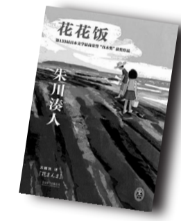
▲《花花饭》▲ 作者:朱川湊人 北京联合出版公司