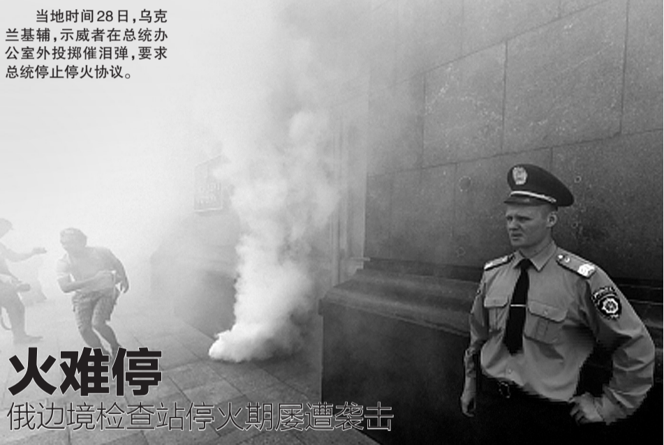
当地时间28日，乌克兰基辅，示威者在总统办公室外投掷催泪弹，要求总统停止停火协议。