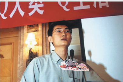
2002年,小马哥被网友戏称为“网络QQ聊神”

1999年2月10日,腾讯发布了QQ的第一个版本。当时的QQ,还叫OICQ。前不久福布斯发布2014华人富豪榜,企鹅再度帮助马化腾成为中国互联网行业最吸金富豪(134亿美元),位列华人榜第6位,为BAT三巨头翘楚。