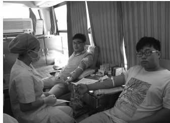
薛城采血点的两个好朋友相约献血者日一起献血。

此次献血宣传周活动,将进一步提高广大市民对安全血液需求的认识,扩大无偿献血者队伍,为包括孕产妇在内的所有患者提供安全、充足的血液。激励未参加献血的健康人群开始参加无偿献血,承担起为和谐社会慷慨献血的时代责任。