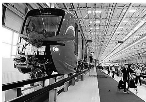
中国北车造地铁首进南美

此外，一些世界杯官方授权的小纪念品，例如按比例缩小的大力神金杯，它们都来自中国东莞。