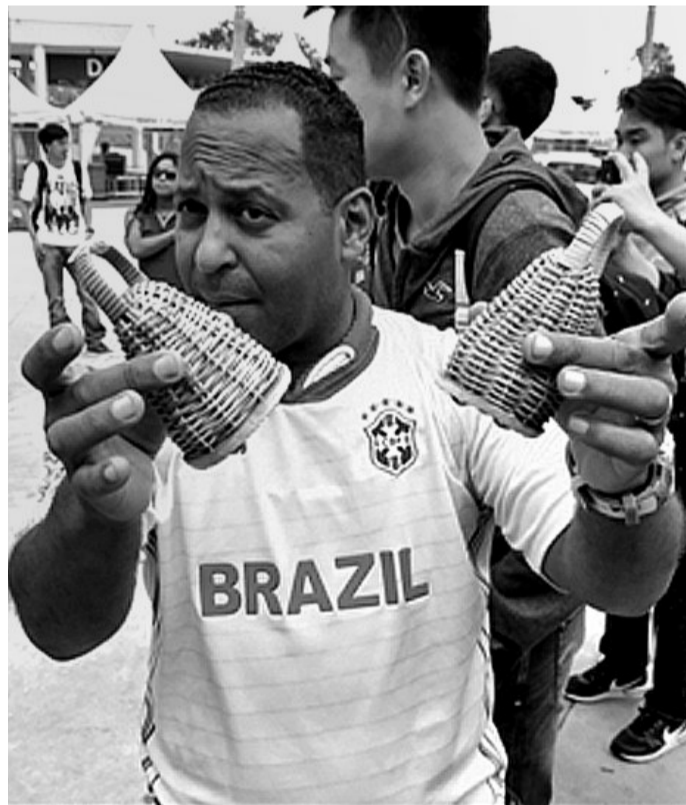
球迷手拿助威神器“卡塞罗拉”

球场内人员密集，如何防暑降温成为一道难题。中国企业美的旗下的“美的开利”成为了巴西世界杯球场制冷工程的大赢家，它负责12座球场中9座球场的制冷任务。