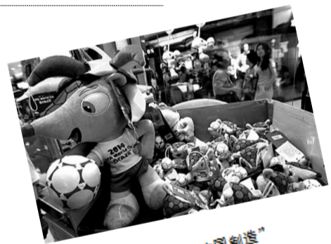
几乎所有小饰品都是“中国制造”