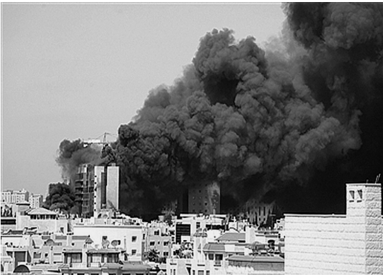
2013年8月5日，约旦安曼，一在建大楼被人纵火，恐怖气氛弥漫。