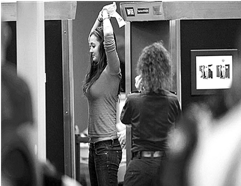
美国实施全民反恐，对乘客实施全身扫描检查，也叫“裸检”。

在反恐技术研发方面，以色列遥遥领先。目前，国土面积堪称弹丸之地的以色列，已经有450多家非军事工业公司从事与反恐怖安全有关的技术开发和产品研制工作，而且这一数字还在增加。以色列的反恐怖安全类产品出口额超过10亿美元。