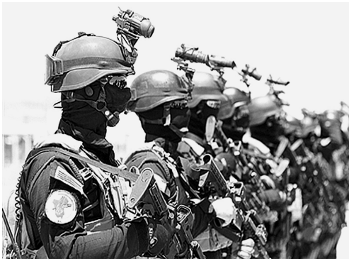
2013年7月19日，伊拉克反恐部队亮相巴格达国际机场。

此外，在打击恐怖主义方面，常规警察或者武装部队已经难以应对，因此，许多国家纷纷建立起特种警察部队或者特种部队。据不完全统计，目前世界上已经有近60%的国家拥有反恐部队。这些反恐部队不仅数量上有所增加，而且还提高了招募人员的质量。2012年，英国媒体报道称，英国特种部队在剑桥大学附近建立了秘密训练基地，招募有潜力的年轻大学生加入反恐队伍。