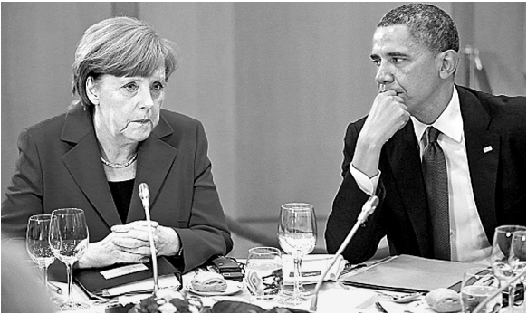
G7峰会领导人共进工作晚餐,由于德国联邦检察官宣布立案调查美国国家安全局窃听总理默克尔手机一事,因此默克尔与奥巴马在晚餐期间虽然邻座,但表情严肃略显尴尬

的斯诺登无法去德国作证,对他来说不安全。德国媒体报道称,司法层面的调查再次将“棱镜门”推向了舆论高潮,并且可能影响到德美关系。